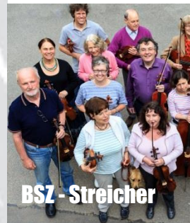
BSZ - Streicher