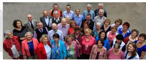
BSZ - Chor

Z wie Zukunft zu gestalten und Brücken zu bauen aus der Tradition der Gründerzeit in unser digitales 21. Jahrhundert, ist Aufgabe und Herausforderung zugleich. Gemeinsam zu musizieren, Teil eines Klangkörpers zu sein fördert das Gemeinschaftsleben und verbindet uns mit anderen Kulturen. Wir wollen durch die Musik Menschen aller Generationen ansprechen und gewinnen.